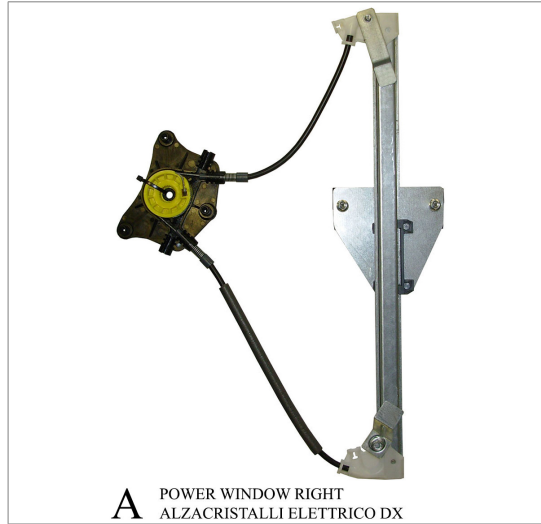
A POWER WINDOW RIGHT ALZACRISTALLI ELETTRICO DX

THIS INSTALLATION INSTRUCTION IS FOR BOTH LEFT AND RIGHT SIDE. CETTE INSTRUCTION DE MONTAGE EST POUR LES DEUX COTES DROIT ET GAUCHE. DIESE MONTAGE-ANLEITUNG IST FÜR DIE BEIDE LINKE UND RECHTE SEITE. ESTA INSTRUCCION DE MONTAJE ES PARA LOS DOS LADOS IZQUIERDO Y DERECHO. ESTAS INSTRUÇÕES VALEM TANTO PARA O LADO ESQUERDO QUANTO PARA O DIREITO. DEZE AANWIJZINGEN GELDEN VOOR ZOWEL DE LINKER- ALS DE RECHTERKANT. Η ΠΑΡΟΥΣΑ ΟΔΗΓΙΑ ΑΦΟΡΑ ΤΟΣΟ ΤΗΝ ΑΡΙΣΤΕΡΗ ΟΣΟ ΚΑΙ ΤΗ ΔΕΞΙΑ ΠΛΕΥΡΑ. LA PRESENTE ISTRUZIONE VALE SIA PER IL LATO SINISTRO CHE PER IL LATO DESTRO.